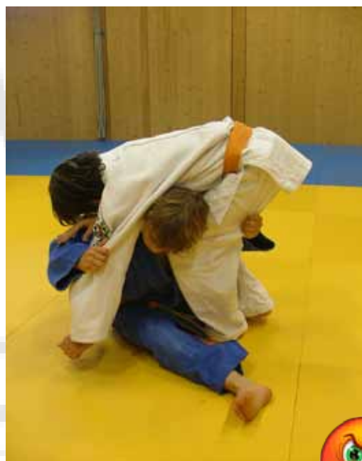
Guruma à partir du sol